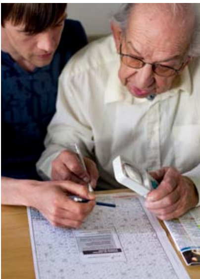
Das Training geistiger Fähigkeiten vermindert das Risiko einer demenziellen Erkrankung.

Positiv wirkt sich dagegen geistige Aktivität aus: Intellektuell tätige Menschen erkranken seltener an der Alzheimer-Krankheit als Personen, die kaum geistig aktiv sind.