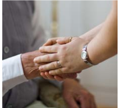
Der/Die Patient(in) benötigt Hilfe bei der Bewältigung der Diagnose.

Für die Aufklärung spricht, dass die erkrankte Person, wenn sie weiß, dass sie an einer Demenz leidet, planen kann, wie sie das Beste aus den kommenden Jahren macht. Sie hat die Möglichkeit, sich an der Organisation der Pflege aktiv zu beteiligen. Die/ Der Kranke kann die wichtigsten finanziellen Entscheidungen noch selbst treffen oder entscheiden, wer sich später um sie/ihn kümmern soll. Aus diesen Gründen geht man heute davon aus, dass jeder Mensch das Recht hat, selbst zu entscheiden, ob er über das Untersuchungsergebnis aufgeklärt werden oder lieber darauf verzichten möchte.