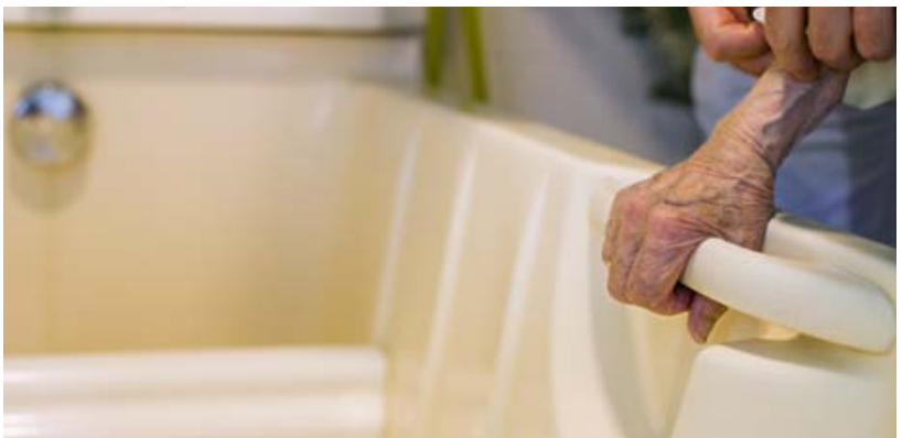
Einfache Hilfen gegen Unfälle.