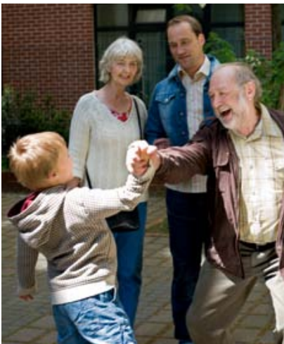
Schaffen Sie sich zur Entspannung feste Erholungszeiten.

Die Betreuung eines demenziell erkrankten Familienmitglieds ist außerordentlich schwer und kann viele Jahre dauern. Es ist ein Irrtum zu glauben, ein einzelner Mensch könne die für die Betreuung erforderliche seelische und körperliche Kraft jederzeit und unbegrenzt aufbringen. Deshalb ist es dringend nötig, den selbst auferlegten Leistungsdruck abzubauen: Kein Mensch kann einen anderen 24 Stunden lang betreuen, versorgen und beobachten, ohne sich selbst dabei völlig zu überlasten. Das Missachten der eigenen Belastungsgrenze schadet aber nicht nur der pflegenden Person, sondern auch dem/der Kranken. Denn Folgen der Überlastung wie Ungeduld oder Reizbarkeit sind häufig die Ursache für Konflikte im Betreuungsalltag. Ein Verteilen der Pflege auf mehrere Schultern, gleichgültig ob auf Familienangehörige oder professionelle Helferinnen oder Helfer, ist oft der beste Weg, die häusliche Betreuung über viele Jahre hinweg aufrecht-erhalten zu können.