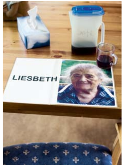
Alzheimer-Patienten benötigen Hilfen zur Orientierung.

Die Ursachen der Alzheimer-Krankheit sind bislang noch nicht ausreichend erforscht. Bekannt ist aber eine Reihe von Veränderungen im Gehirn, die bei Alzheimer-Patientinnen und -Patienten auftreten. Bei der Krankheit kommt es zu einem Absterben von Nervenzellen und ihrer Verbindung untereinander. Damit ist ein Rückgang der Hirnmasse verbunden (Hirnatrophie). Weiterhin werden Eiweißablagerungen (Plaques bzw. Fibrillen) im Gehirn sowie die Verminderung eines für das Gedächtnis wichtigen