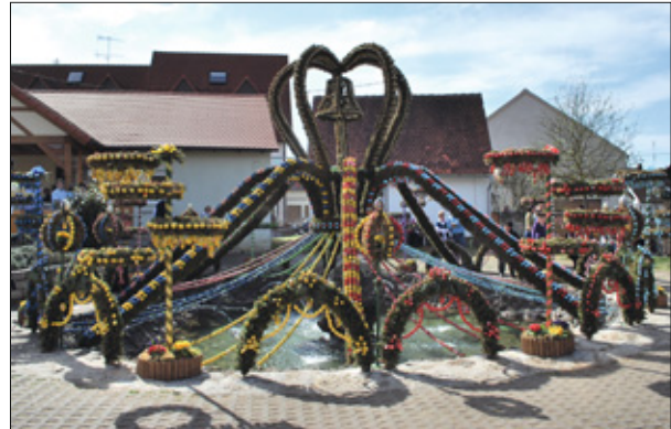
2001 wurde der Osterbrunnen im fränkischen Bieberbach mit 11.108 handbemalten Eiern geschmückt.