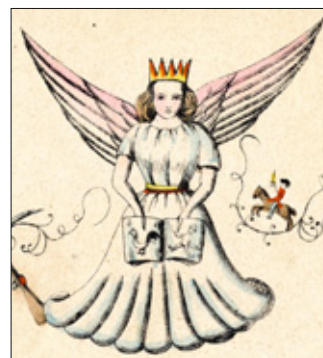
Christkind mit Bilderbuch. Ausschnitt aus der Erstaussgabe des Struwwelpeter (1845).

Ein Brauchtum ist das Aufstellen einer Krippe . Familien haben häufig zu jedem Weihnachtsfest eine neue Krippenfigur hergestellt oder gekauft. Die wichtigste Figur in der Krippe ist das Jesuskind .