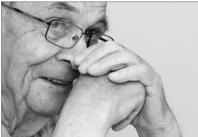
»Früher war nicht alles besser, aber die Menschen haben zusammengehalten.«