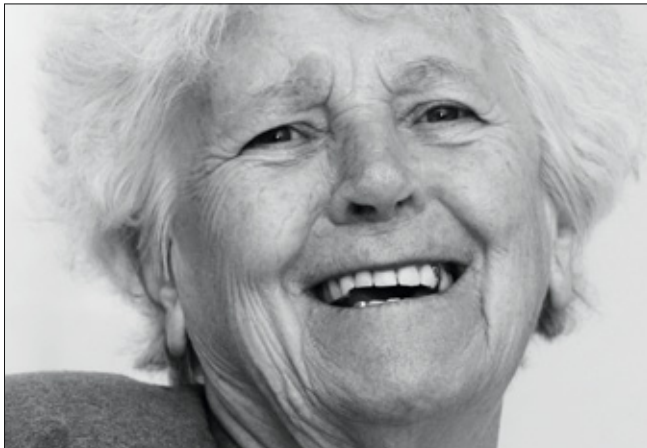
»Wer macht die besten Spätzle?«

Adobe Stock: 9 unten Svetlana Wall | 11 links by-studio | 12 unten K.-P. Adler | 14 links Martin Pohner | 23 links oben Patrick Pazzano | 23 oben rechts/unten Peter Maszlen | 24/38 unten Peter Atkins | 26 rechts Ingo Bartussek | 27 oben babimu | 27 links oben Tommaso Lizzul | 34 links Frog 974 | 37 oben trotzolga | 44 links drubig-photo | 44 rechts jd-photo- design || Wikimedia Commons: 8 links fretwurst | 8 rechts Lewenstein | 25 Santeri Viinamäki || 26 links/27 links unten DAK-Mediendienst || Datengrafik 28 bis 31 Techniker Kranken- kasse || Datengrafik 33/34 links BARMER || 11 rechts Rezept und Bild || 19 bis 21 Deutsche Alzheimer Gesellschaft || 40/41 Sven Fritzsich || Alle weiteren Fotos © bei den AutorIn- nen oder der Alzheimer Gesellschaft Baden-Württemberg e.V.