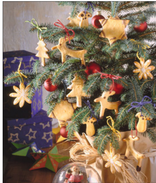
Ein traditionell geschmückter Baum mit Weihnachtskugeln und Ausstecherle – so kann das Gebäck auch verwendet werden!

Am Vorabend oder am Heiligen Morgen wird der Baum in der Wohnung aufgestellt. Meistens war und ist dies die Aufgabe der Männer. Viele Familien haben Bräuche und Traditionen, wie der Baum geschmückt wird. Eine Teilnehmerin erzählt von kleinen roten Äpfeln, Nüssen, Lebkuchen, »echten Wachskerzen«, kleinen Spielfiguren, Glaskugeln, Strohsternen und Lametta.