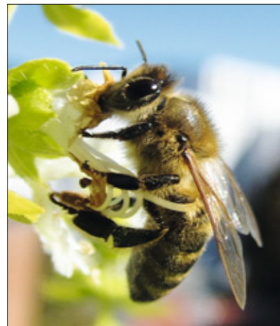
Eine Honigbiene »trinkt« an einer Basilikumblüte.

königin ist recht groß, da sie im Normalfall als Einzige Eier legen kann und so für Nachwuchs sorgt. Sie lebt drei bis fünf Jahre.