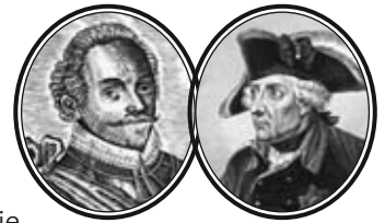
Friedrich der Große (1712 – 1786), auch »Alter Fritz« genannt

Seit über 400 Jahren wird die Kartoffel in Europa angebaut. Der berühmte Seefahrer Sir Francis Drake schätzte die Kartoffel auf seinen Reisen als guten Proviant. Durch ihren hohen Vitamin-C-Gehalt schützte sie vor Skorbut. Eine Dame erinnert sich an den Preußenkönig Friedrich den Großen , der per Dekret Anweisungen zum Anpflanzen der Kartoffel auf den königlichen Feldern gab.