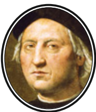
Christoph Kolumbus (1451 – 1506)

Dort war die Kartoffel schon 8.000 vor Christus bekannt. Sie galt als »beseelt« und wurde mit ihren sprießenden Keimen und Augen als Symbol der Fruchtbarkeit verehrt. Bei den Inkas gab es eine Kartoffelgottheit, die Axomamma .