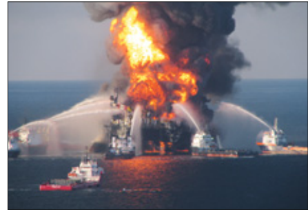
Mitte: Öl-Bohrinseln vor der Küste. Rechts: Die Bohrplattform »Deepwater Horizon« im Golf von Mexiko geriet 2010 in Brand und ging zwei Tage später unter. Elf Arbeiter starben. 87 Tage lang strömten etwa 800 Mio. Liter Öl ins Meer – die schwerste Umweltkatastrophe ihrer Art in der Geschichte.

men sind. Wir erinnern uns an die Ölkrise im Jahr 1973. Da waren Heizöl und Benzin knapp, und es gab autofreie Sonntage in Deutschland. Eine Dame erzählt von ihrer Fahrradtour auf der Autobahn. An anderen Sonntagen waren entweder gerade oder ungerade Autokennzeichen auf der Straße erlaubt.