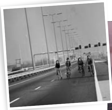
Während der Ölkrise 1973 fand der erste »Auto-freie Sonntag« (25. November) statt, vier weitere folgten im selben Jahr. Staunend nutzten viele Bundesbürger*innen die Möglichkeit, eine Autobahn zu Fuß oder per Fahrrad zu erkunden.