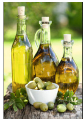
Fester Bestandteil der mediterranen Küche: Olivenöl.

Auf dem Tisch stehen verschiedene Speiseöle, in kleinen Gläsern vorbereitet. Wir riechen, probieren einige Tropfen und erkennen die unterschiedlichen Farbnuancen von dunkelgelb bis fast weiß. Manche Öle werden zum Kochen und Backen benutzt, da sie gut erhitzt werden können. Wir erinnern uns an das Frittieröl. Viele Familien besaßen diesen bekannten schwarzen Topf mit einem Gitterkorb. »Pommes«, bemerkt eine Dame, »das war ein Sonntagsessen. Aber es hat danach in der Küche ziemlich stark gerochen.«