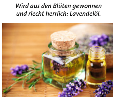
Wird aus den Blüten gewonnen und riecht herrlich: Lavendelöl.

Wo werden Öle noch verwendet? »Ich bade gerne in Lavendel- oder Fichtennadelöl«, erzählt eine Dame. »Es riecht so gut und tut wohl.« Ebenso gibt es viele angenehme Öle zur Körpermassage, und natürlich erinnern sich